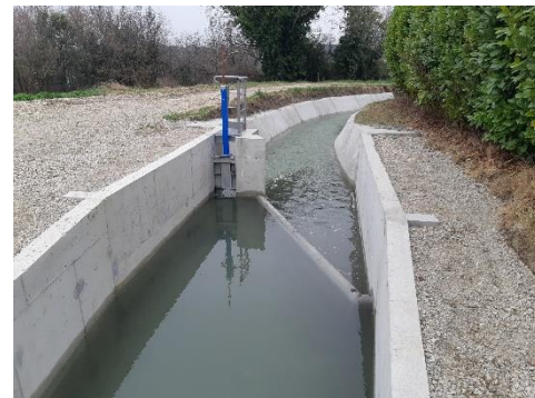
Seuil sur le canal maître, mis en place lors de l'hiver 2021/2022 à Manosque, Les Adrechs

De même pour le canal maître, de nombreux ouvrages de régulation et de télégestion ont été mis en place afin d'adapter au mieux les prélèvements et le transport d'eau. De plus, certaines sections ont été cuvelées afin de réduire les pertes d'eau par infiltration.