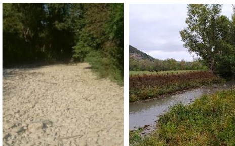
Amont et aval du rejet du canal dans le Largue

De plus, le canal de Manosque a permis d'alimenter, sur sa partie aval, le Largue qui est l'un des cours d'eau les plus impactés par la sécheresse du département et dont le bassin versant a même atteint le stade de crise pendant l'été.