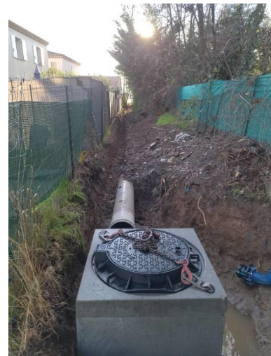
Réseau basse pression mis en place lors de l'hiver 2021/2022 à Villeneuve, Le Thor

De même pour le canal maître, de nombreux ouvrages de régulation et de télégestion ont été mis en place afin d'adapter au mieux les prélèvements et le transport d'eau. De plus, certaines sections ont été cuvelées afin de réduire les pertes d'eau par infiltration.